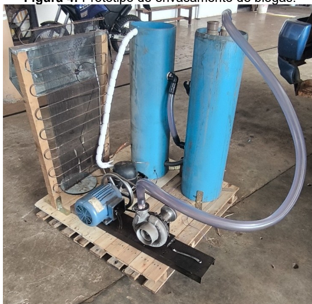
Figura 4: Protótipo de envasamento de biogás.