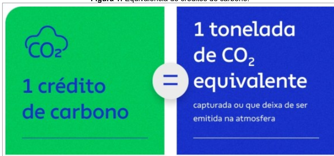
Figura 1: Equivalência de créditos de carbono.

Conforme Ribeiro (2005), o funcionamento do mercado de créditos de carbono é simples: um crédito de carbono equivale a uma tonelada de dióxido de carbono (CO 2 ), ou seja, quantos mais créditos de carbono um país ou empresa produz, menos toneladas de gases do efeito estufa são emitidos na atmosfera, essa equivalência pode ser melhor visualizada na Figura 1.