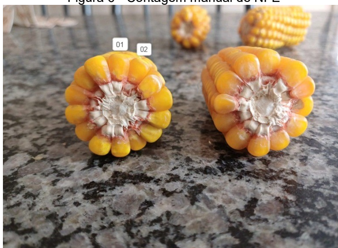
Figura 6 - Contagem manual de NFE

Para contabilizar essas variáveis foram utilizadas 5 plantas ao acaso das linhas centrais de cada tratamento, com espigas viáveis, sendo realizado o cálculo para obter a média de NEP e para o NFE foi dividida a espiga ao meio e realizado a contagem manual dos grãos, conforme a Figura 6.