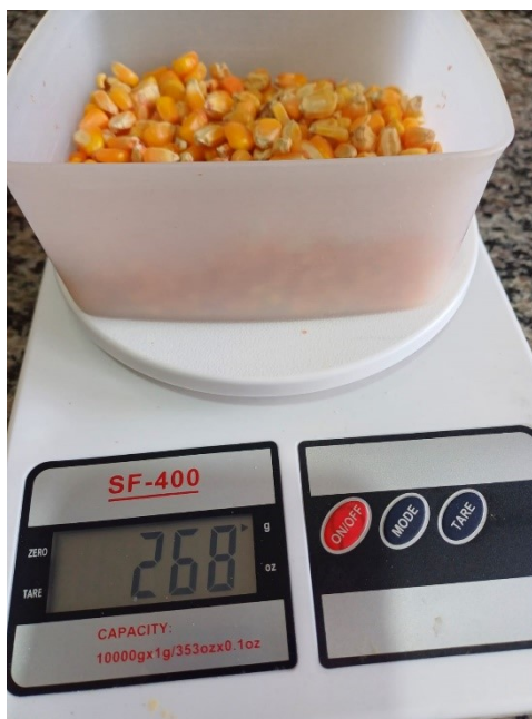
Figura 7– Avaliação de massa de grãos de milho

Para obter a massa média de mil grãos foram retirados ao acaso 1000 grãos de milho de 5 plantas das linhas centrais de cada tratamento, pesados em uma balança de precisão conforme Figura 7.