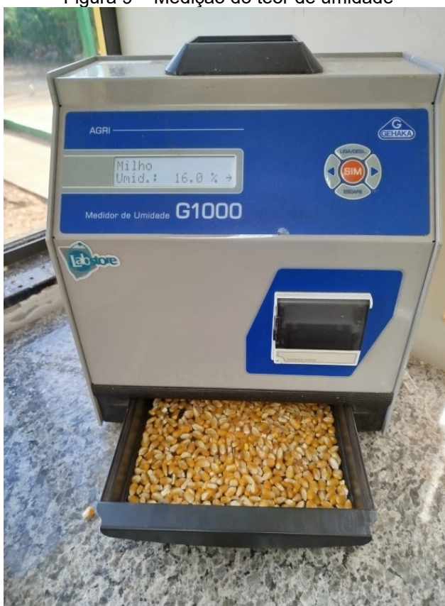
Figura 9 – Medição do teor de umidade