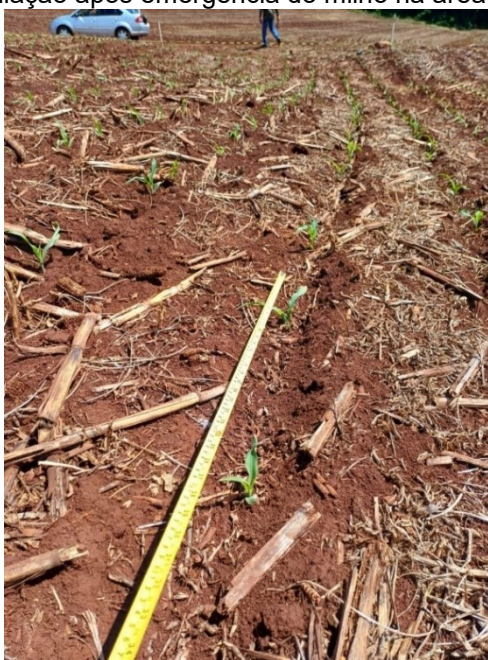
Figura 4 – Avaliação após emergência do milho na área do experimento

O estande de plantas avaliadas após emergência do milho (Figura 4) foi de 2,75 plantas/m 2 com uma população final de 55.000 plantas/ha.