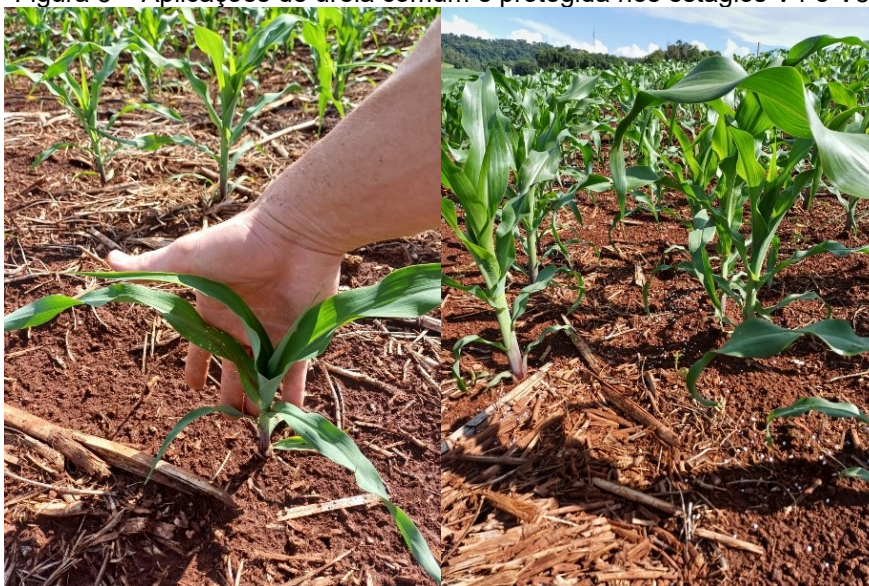
Figura 3 – Aplicações de ureia comum e protegida nos estágios V4 e V8