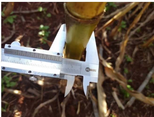
Figura 5 – Avaliação de diâmetro de colmo no milho