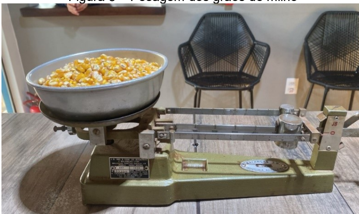
Figura 8 – Pesagem dos grãos de milho