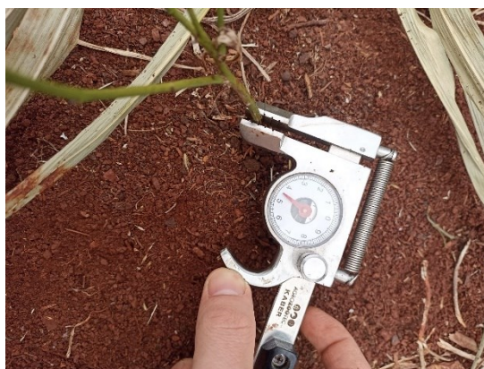
Figura 6 - Medida da espessura de caule com paquímetro.