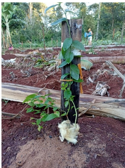
Figura - 4 Estratégia de manejo preventivo com lã de carneiro para proteção do caule contra formigas cortadeiras