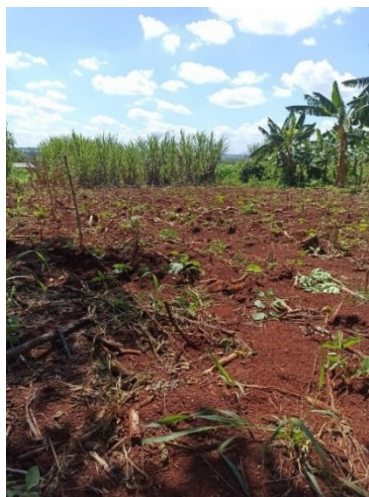
Figura 2. Marcação da área que foi destinada para a implantação das variedades de mirtilo.

da área experimental (Figura 2), foi realizado a coleta de solo para análise de pH. As mudas foram adquiridas da empresa Frutplan, localizadas em Pelotas, Rio Grande do Sul (RS), e o recebimento das mesmas pode ser observado na Figura 3.