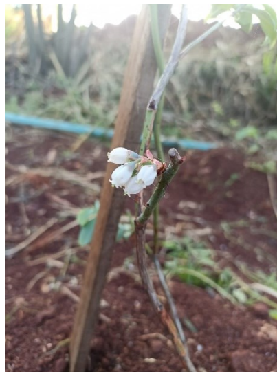
Figura 7 – Flores de mirtilo da variedade Bluebelle cultivados no Assentamento Antônio Tavares, localizado na comunidade Nova Roma, no município de São Miguel do Iguçu – PR.