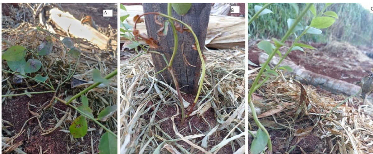
Figura 5 - Manchas foliares em mirtilo (A) e sua progressão para seca dos ramos (B e C).