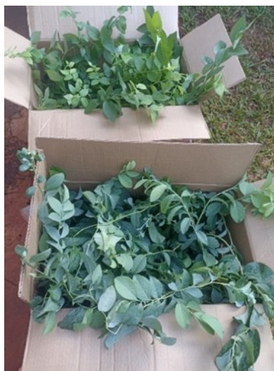
Figura 3 - Recebimento de Mudas de Mirtilo da Frutplan, Pelotas, Rio Grande do Sul.